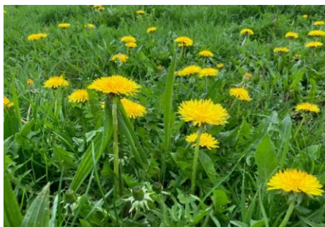
Proche de chez vous : la floraison du pissenlit - le repère des 500°C j - pour la fin du déprimage